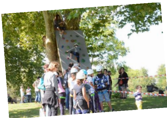
La fête du Sport en Famille