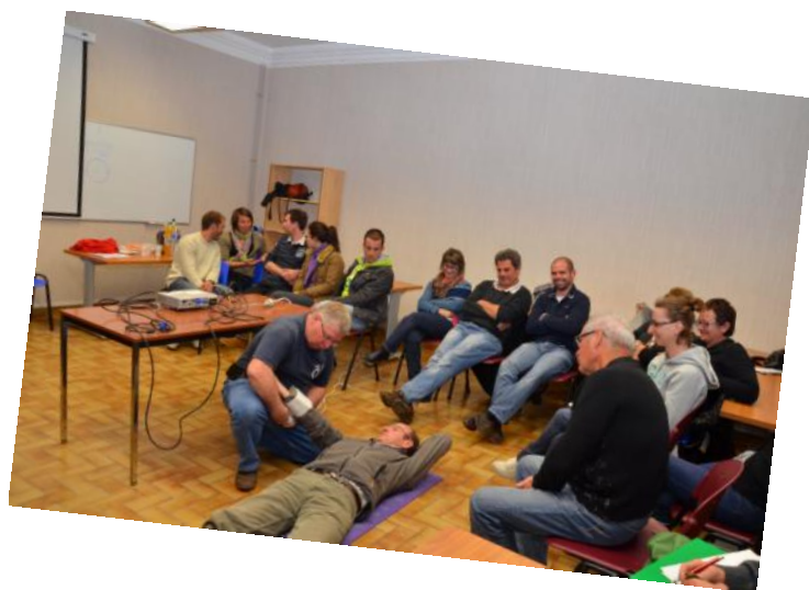
Les Formations/ soirées CRIB