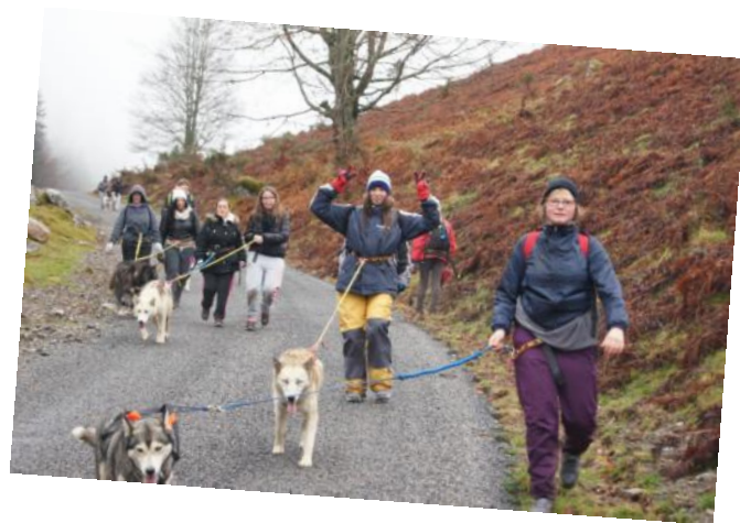
Pyrénées Terre et Eau