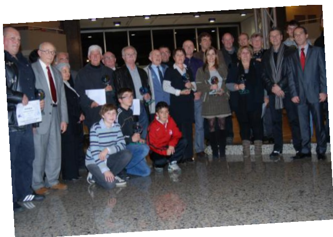
Les Trophées du Bénévolat