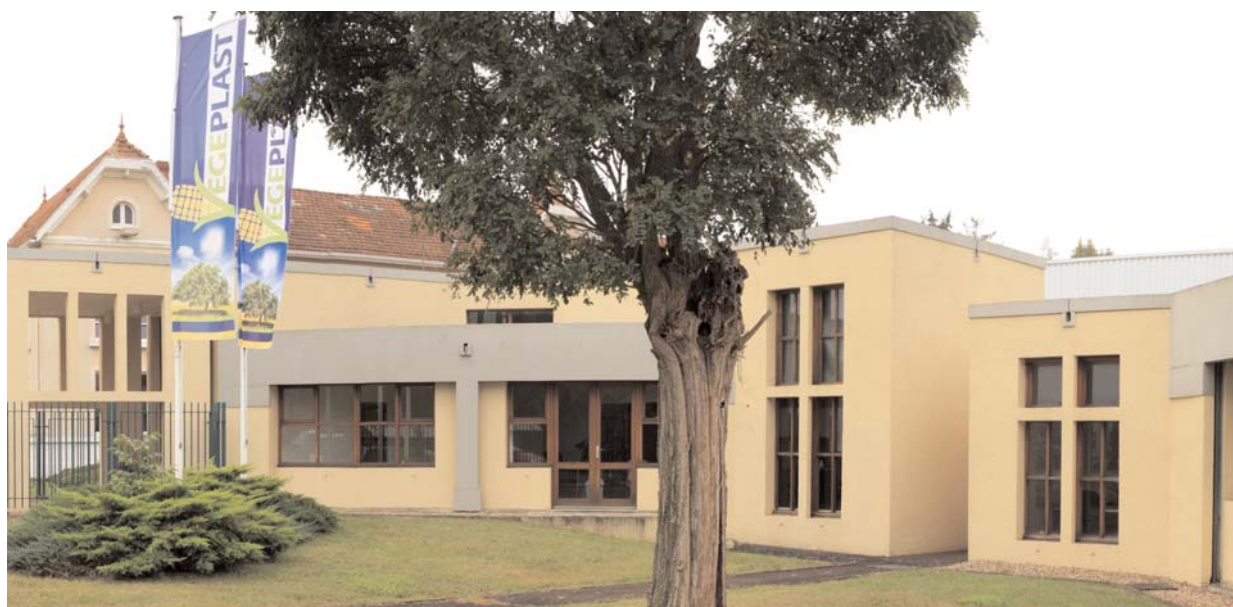
L'entreprise VEGEPLAST à Bazet.

L'unité de 35 personnes aujourd'hui projetée de créer 30 emplois à 5 ans.