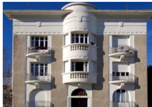
Lourdes, rue des Rochers