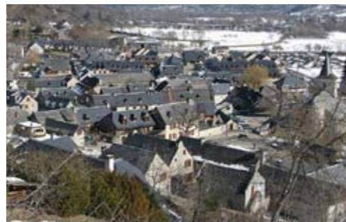
Village de Vignec