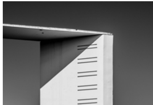
Tarbes, Clinique Ormeau-Pyrénées