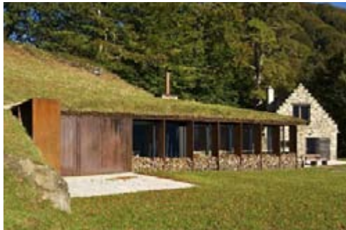
Extension de grange à Lesponne, architectes J. Puig-G. Pujol

Exposition des CAUE d'Occitanie, parcours illustrant l'histoire de l'architecture régionale de 1977 à nos jours. 40 édifices publics et privés, répartis sur les 13 départements qui composent la région ont été sélectionnés.