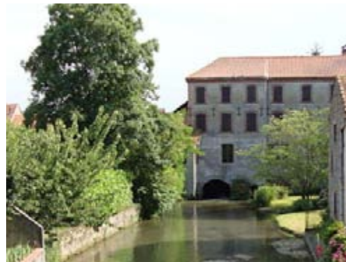
Moulin à Maubourguet