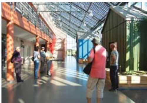
Bordères-sur-Echez, école - Architecte JP Pagnoux

Exposition de projets d'architectes du département des Hautes-Pyrénées qui ont pour objectifs de réduire l'impact négatif du bâtiment sur son environnement et de maîtriser en particulier la consommation d'énergie : choix des techniques, des méthodes de gestion, sélection des matériaux employés et organisation interne des fonctions et des espaces.