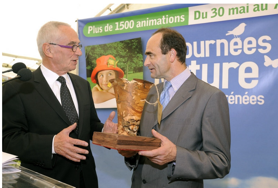
Le Lycée Adriana de Tarbes avait été récompensé en 2009 - © Emmanuel Grimault