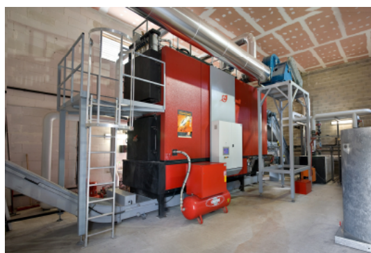
Réseau de chaleur bois des Quatre Routes (Lot)

Au travers de son Plan Climat I (2000-2010) et sa prolongation en début d'année avec un Plan Climat II, la Région s'est engagée dans la réduction des consommations d'énergies et la lutte contre le changement climatique au niveau local.