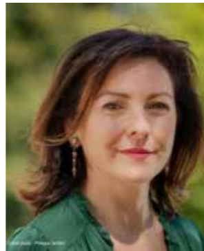
Carole Delga Présidente de la Région Occitanie/ Pyrénées-Méditerranée

Pas de grands discours donc, mais des actions concrètes pour « voyager local » plus facilement et profiter de notre belle région tout en soutenant la filière.