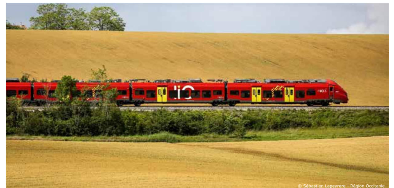
© Sébastien Lapeyre - Région Occitanie