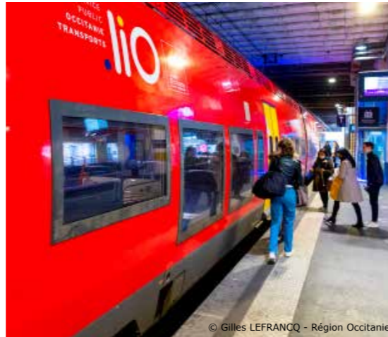
© Gilles LEFRANCO - Région Occitanie