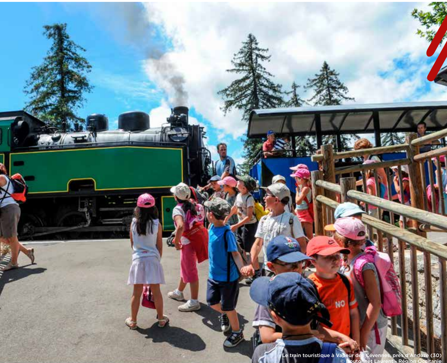
Le train touristique à Vapeur des Cévennes, près d'Anduze (30)

La Région accorde une subvention annuelle de 625 000€ pour financer cette opération sur l'ensemble du territoire, aux côtés des autres partenaires.