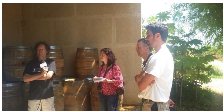
Château des Hospitaliers Agriculteurs Innov'Action 2015 Hérault

Du champ à l'assiette : le tout nouveau drive fermier Hérault Lozère