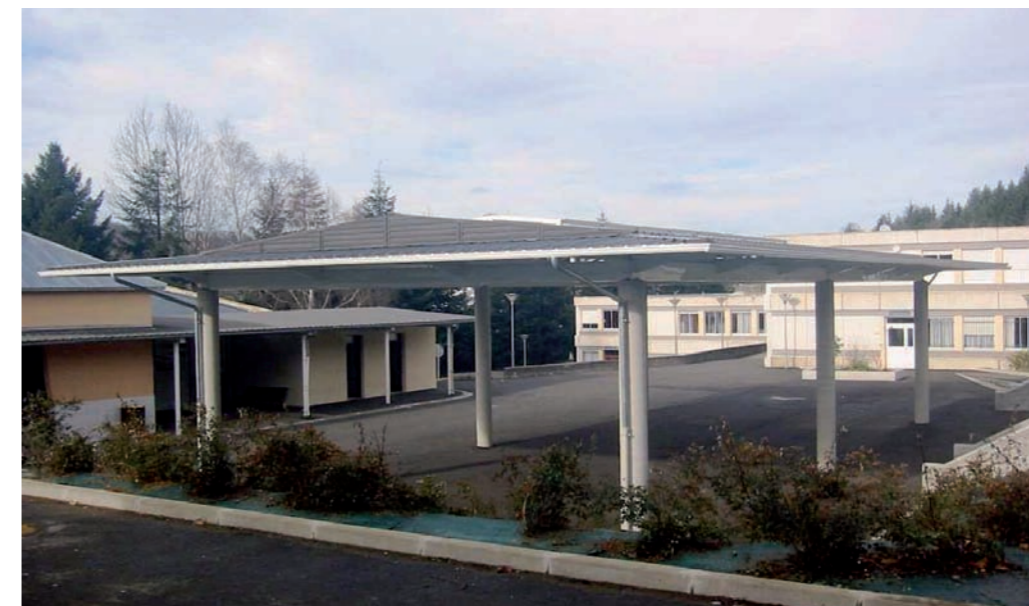
Préau du collège de Serre de Sarsan à Lourdes.