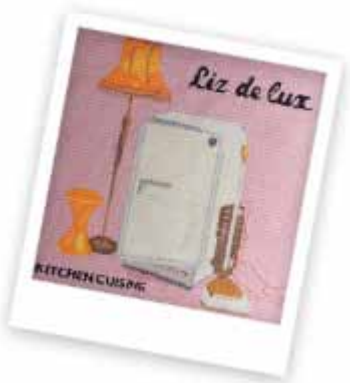
Liz de Lux