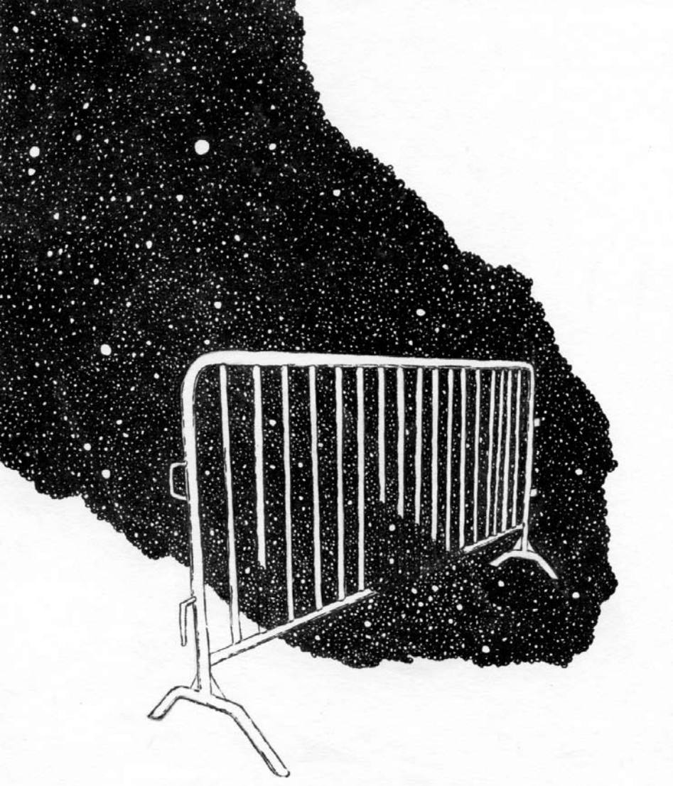
Andréa Damase, Objets Célestes , 2014