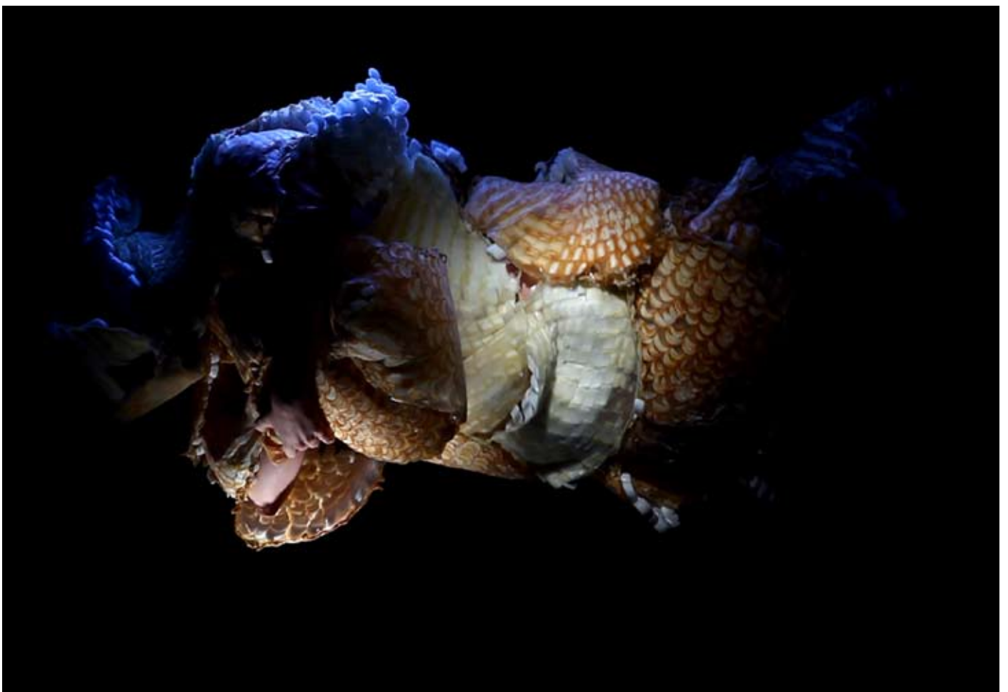
Gaëlle Gourgues, Imago , 2014