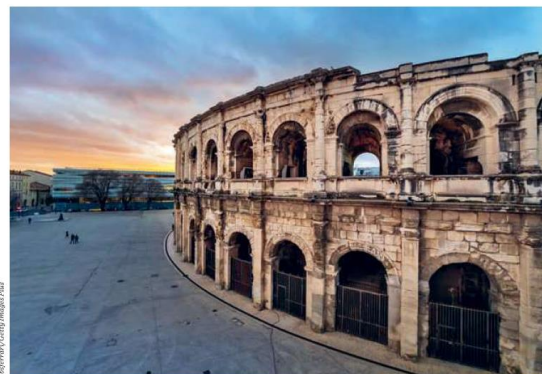
Les arènes de Nîmes.