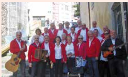
Le groupe Lous Tilholes

Un concert de chants traditionnels polyphoniques est proposé par le groupe Eths Bigorrak qui explore depuis plus de 20 ans le répertoire vocal de l'Occitanie. Pour cette soirée, il invite un autre groupe, Lous Tilholes.