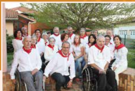
Le groupe Eths Bigorrak

Un concert de chants traditionnels polyphoniques est proposé par le groupe Eths Bigorrak qui explore depuis plus de 20 ans le répertoire vocal de l'Occitanie. Pour cette soirée, il invite un autre groupe, Lous Tilholes.