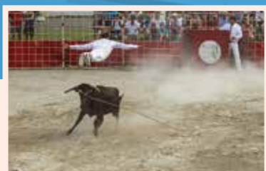
« Le saut de l'ange »

Du 1 er décembre 2018 au 11 janvier 2019 – salles de la Mairie