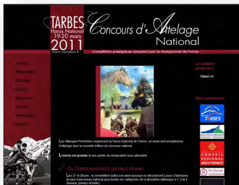
Sur le site internet