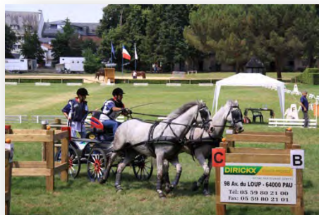
Sur un obstacle de marathon