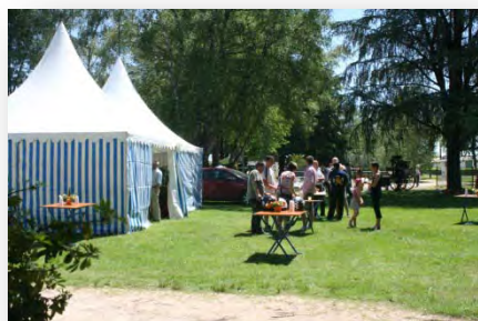
Un stand dans le village

Qualificatif pour le championnat de France