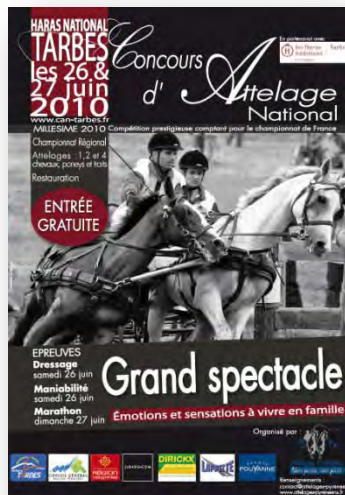
Sur les supports de communication