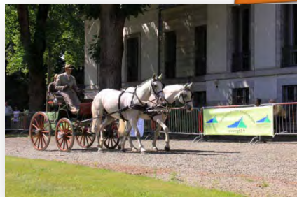
Autour des carrières