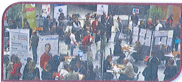
Le forum Emploi de Graulhet-Gaillac (Tarn, 2013)

Un onglet a été créé pour les forums concernant les Métiers de la montagne, qui concernent plus particulièrement les personnes cherchant des emplois saisonniers.