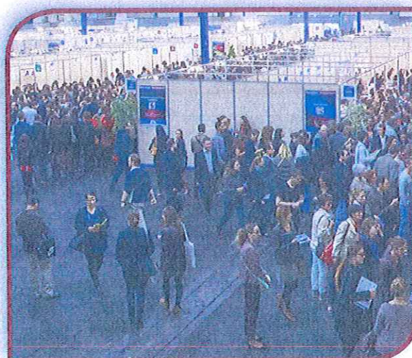
Rencontres & Recrutements (2013), à Toulouse

Sans oublier les étudiants en dernière année d'étude qui peuvent prendre des premiers contacts ou venir chercher de l'information ( Rencontres & Recrutement propose notamment une focale sur l'alternance).