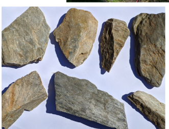
Les pierres sont sélectionnées pour assurer l'intégration paysagère de l'ouvrage.

Le lac d'Oô se trouve aussi à la croisée de deux zones Natura 2000 : Haute Vallée d'Oô , zone spéciale de conservation des habitats et Val-lées du Lys, de la Pique et d'Oô , zone spéciale de protection des oiseaux. Cette spécificité a nécessité la concertation avec la Ligue pour la protection des oiseaux, l'Office français de la biodiversité et les associations environnementales locales pour minimiser l'impact sur les espèces protégées présentes sur site.