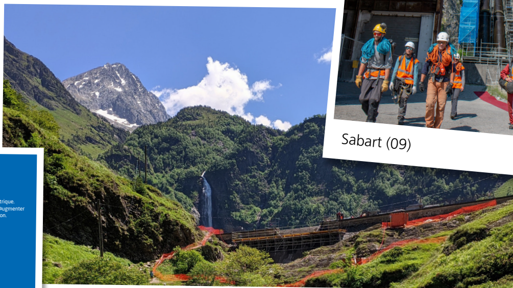
Lac d'Oô (31)