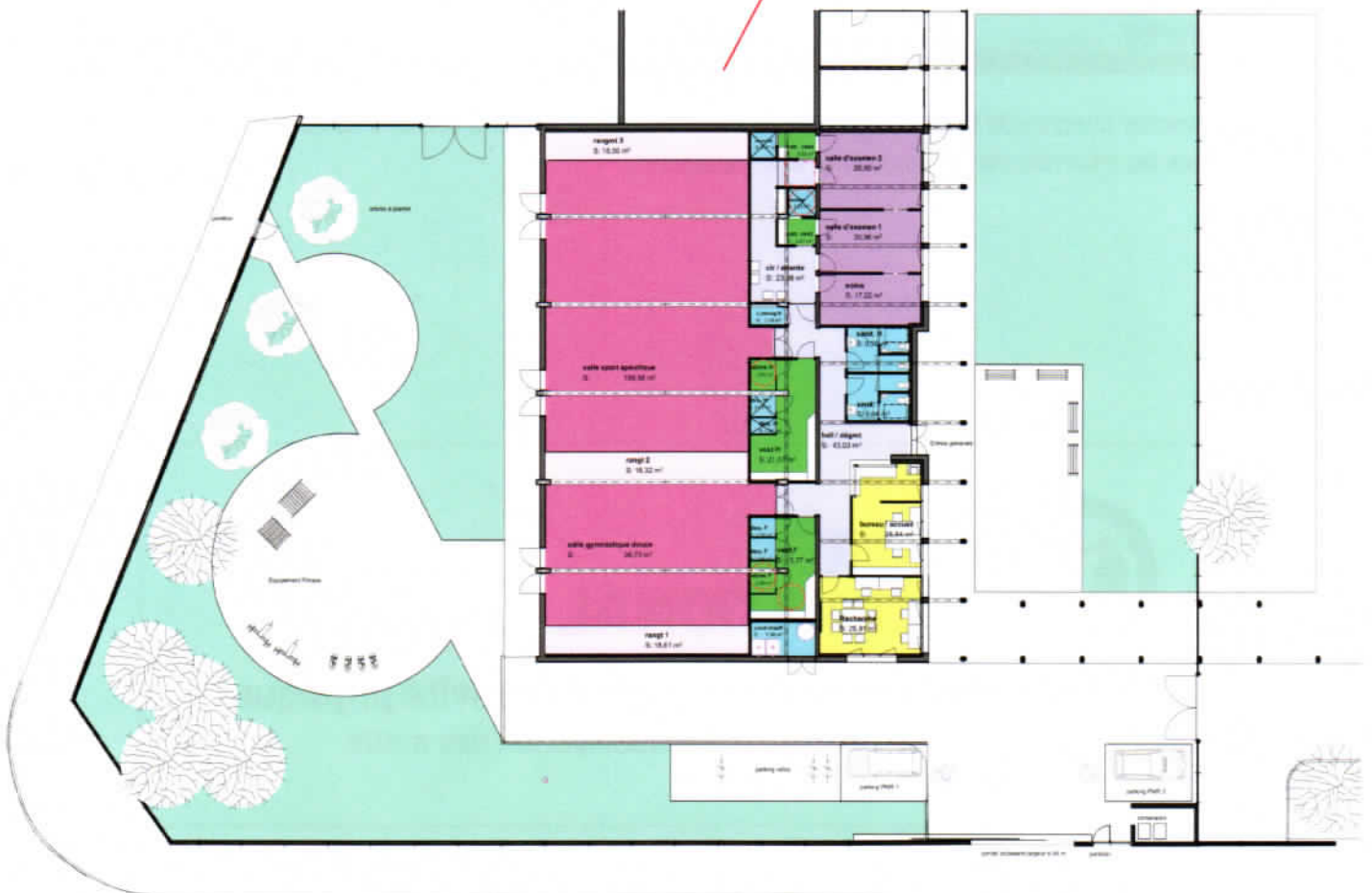
Avenue Pierre de Coubertin